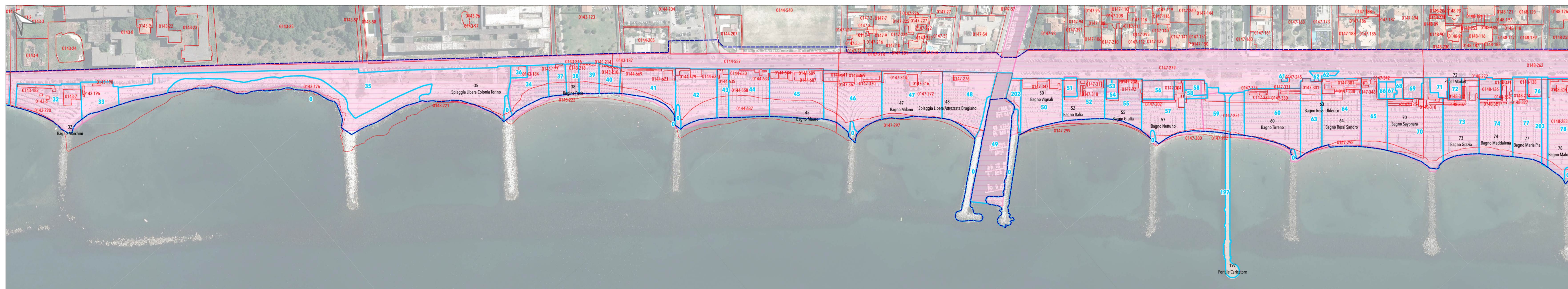
Tratto costiero 3 (Ex Colonia Torino foce del Brugiano)