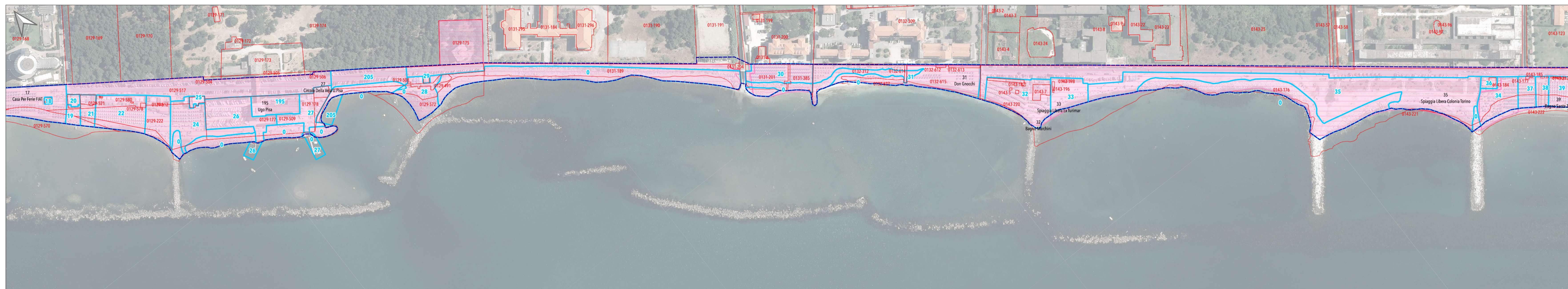
Tratto costiero 2 (ex Colonia Fiat ex Colonia Torino)