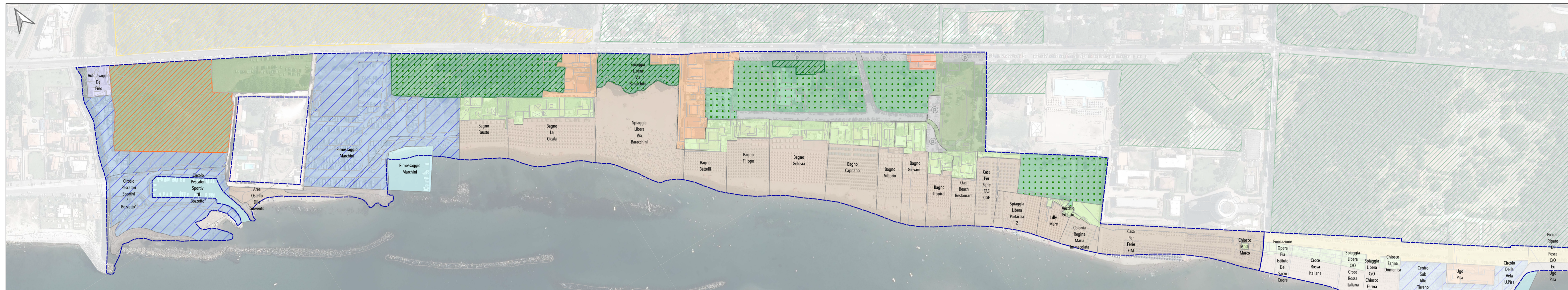
Tratto costiero 1 (Foce del Livello ex Colonia Fiat)