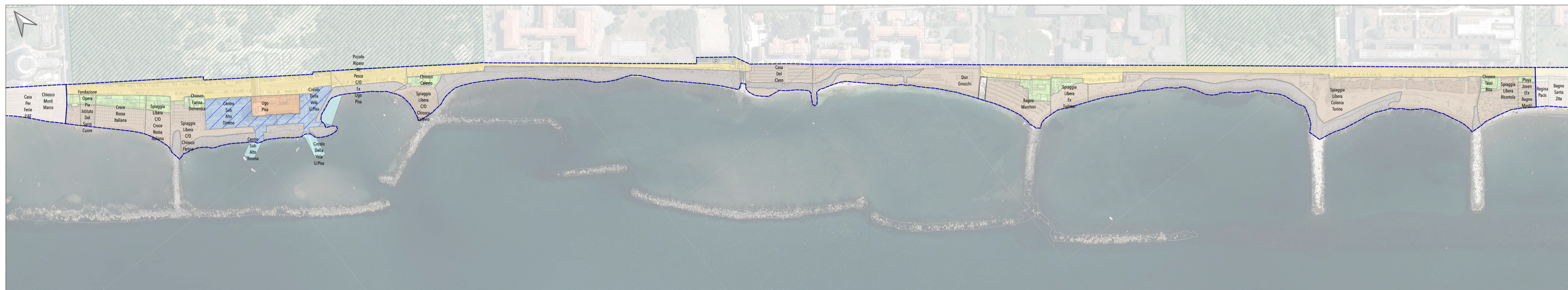
Tratto costiero 2 (ex Colonia Fiat ex Colonia Torino)