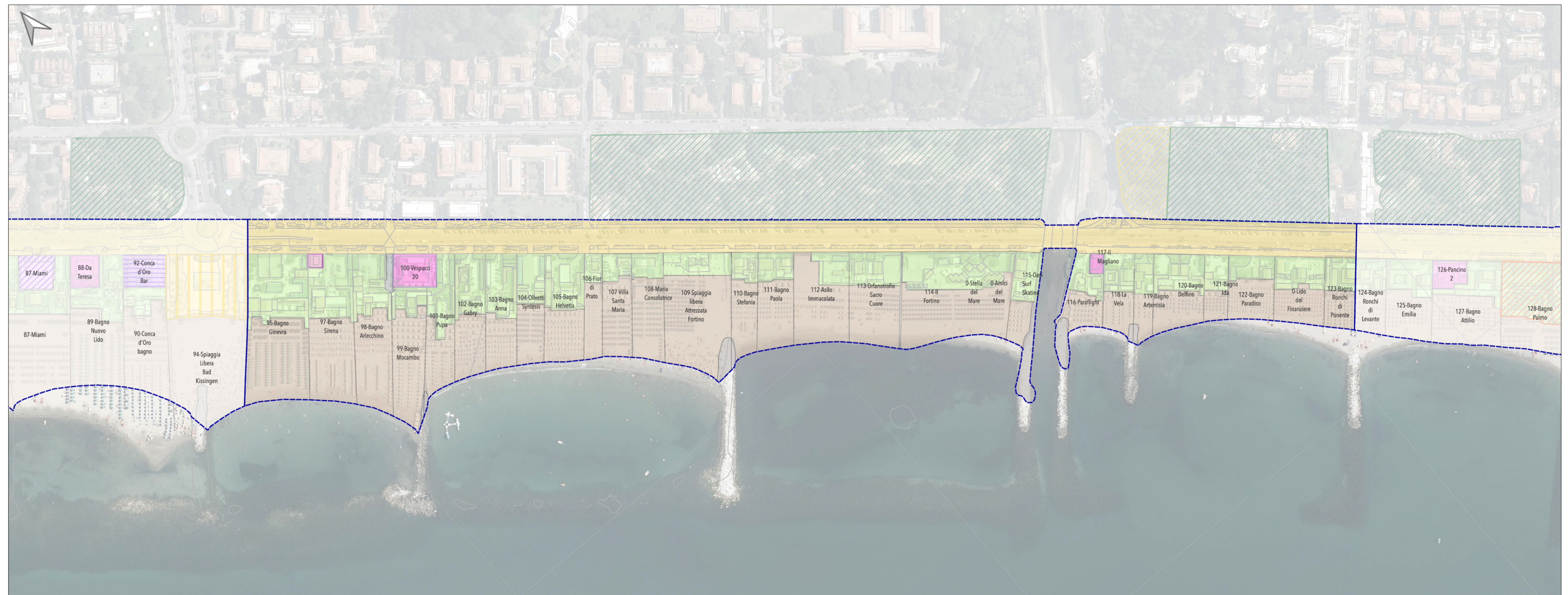
Tratto costiero 5 (Piazza Bad Kissingen- Piazza Ronchi)