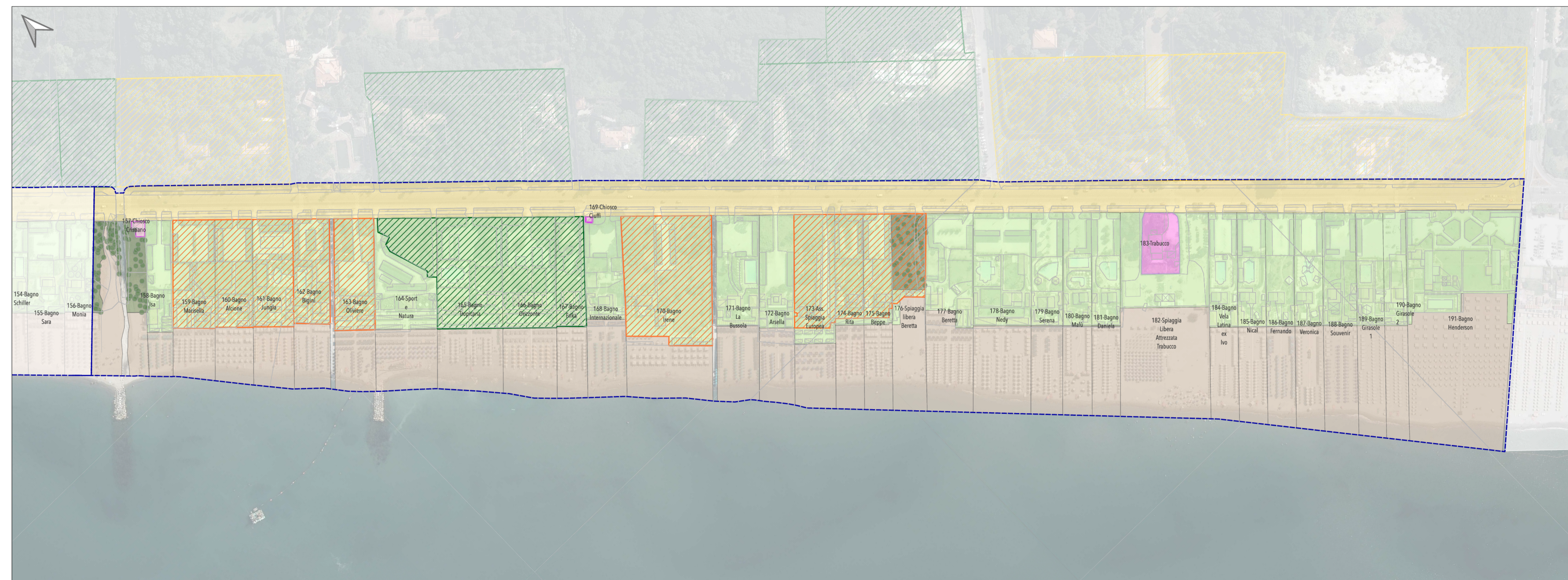
Tratto costiero 7 (Fosso Poveromo- Cinquale)