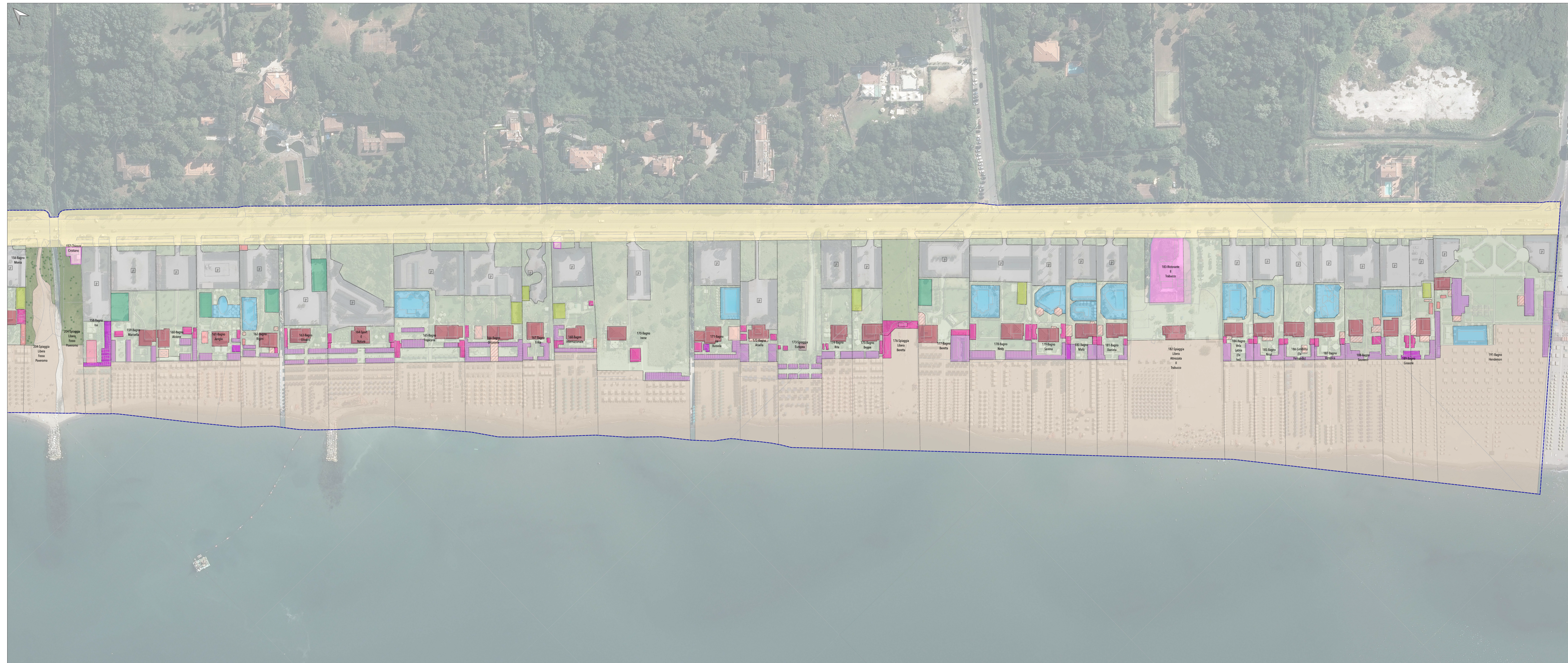
Tratto costiero 7 (Fosso Poveromo- Cinquale)