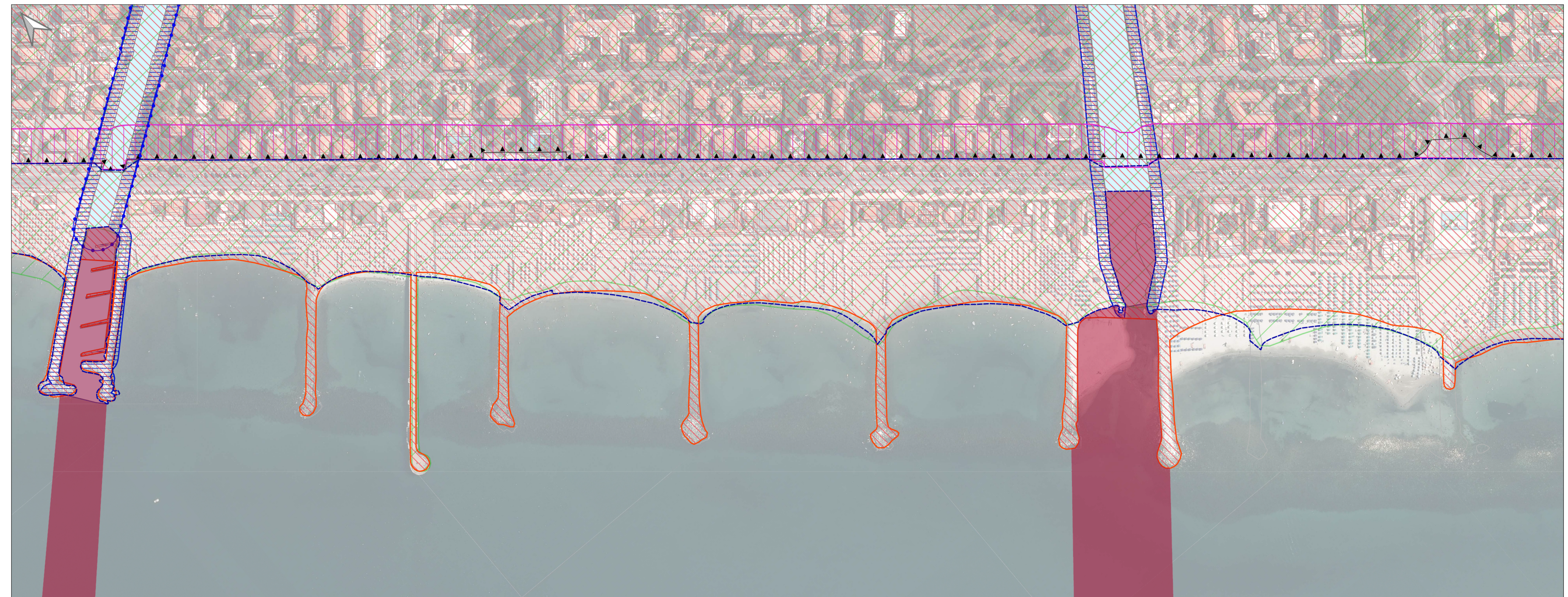
Tratto costiero 4 (Foce del Brugiano-Piazza Bad Kissingen)