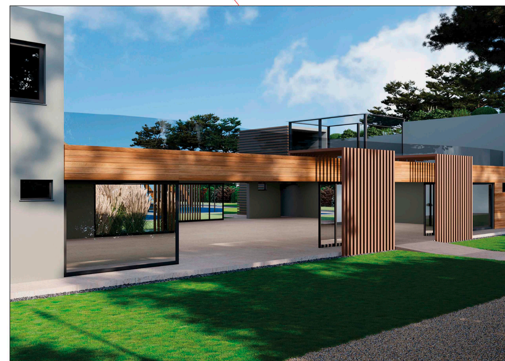
Vista della club house (porzione centrale) dove sono ubicati gli accessi (fronte e retro) totalmente attraversabile alla percezione visiva e fisica.