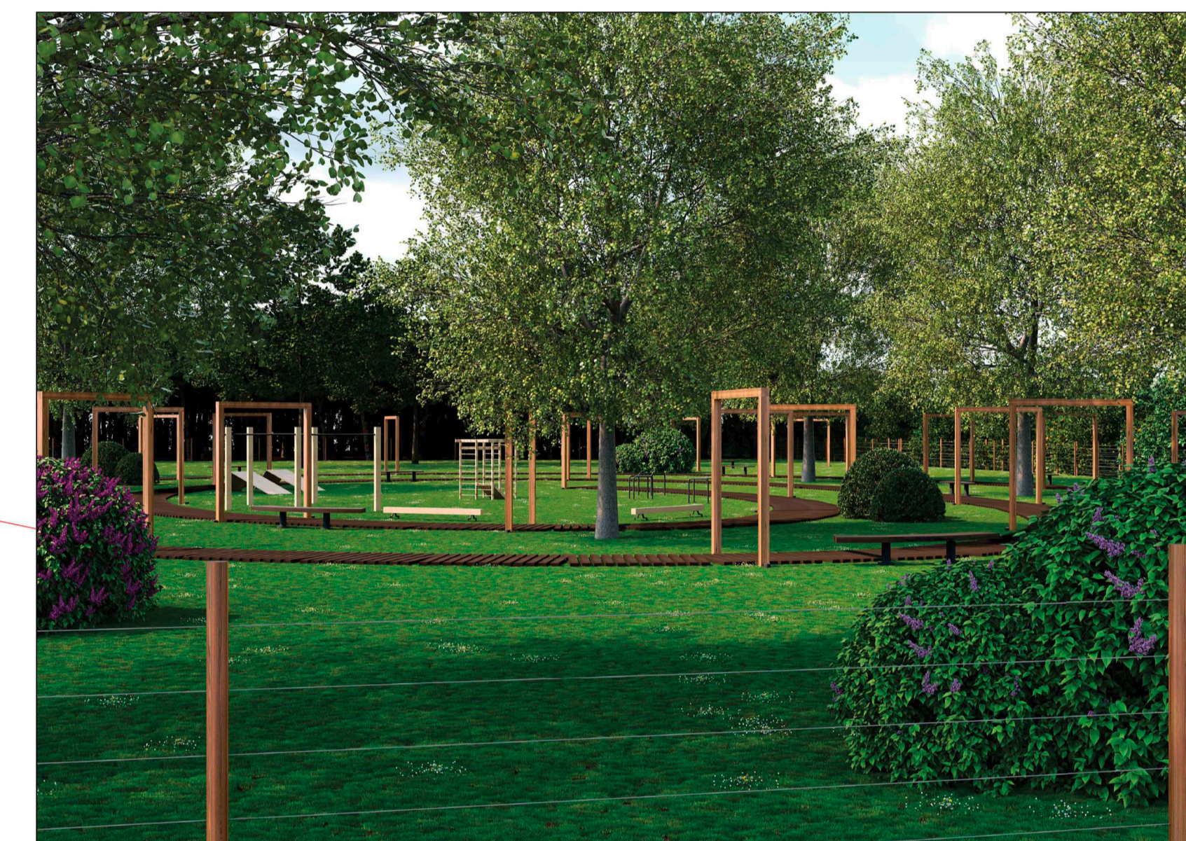
Vista del "cuore" del parco ad uso pubblico . Percorsi naturali, panchine per la sosta, semplici attrezzature per lo sport e lo svago, punti luce posti al piede dei portali lignei.