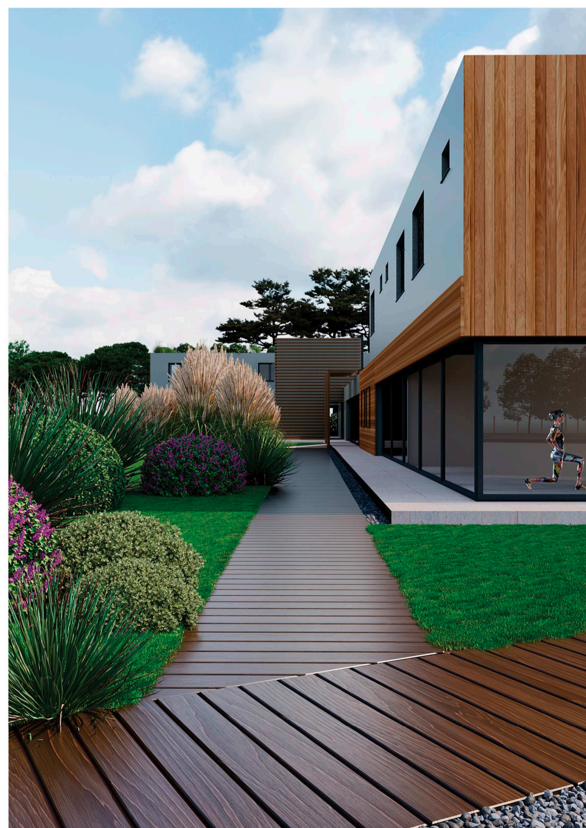
Vista dell'ingresso posteriore alla club house, palestra a P.T., corpo scala-ascensore foresteria a P.1°.