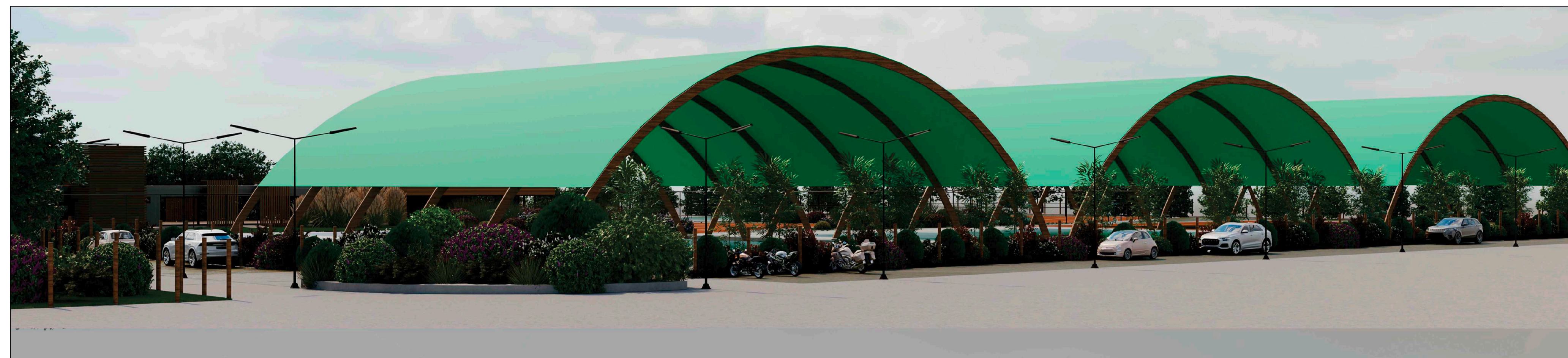
Vista delle coperture in archi lamellari lignei, in fregio a via Marradi, area parcheggio e fascia di manovra.