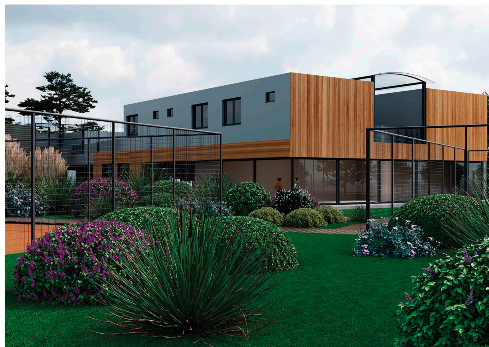
Vista della club house (porzione interna al Lotto), giardini/aiuole multicolori con specie arbustive tipiche della macchia mediterranea.