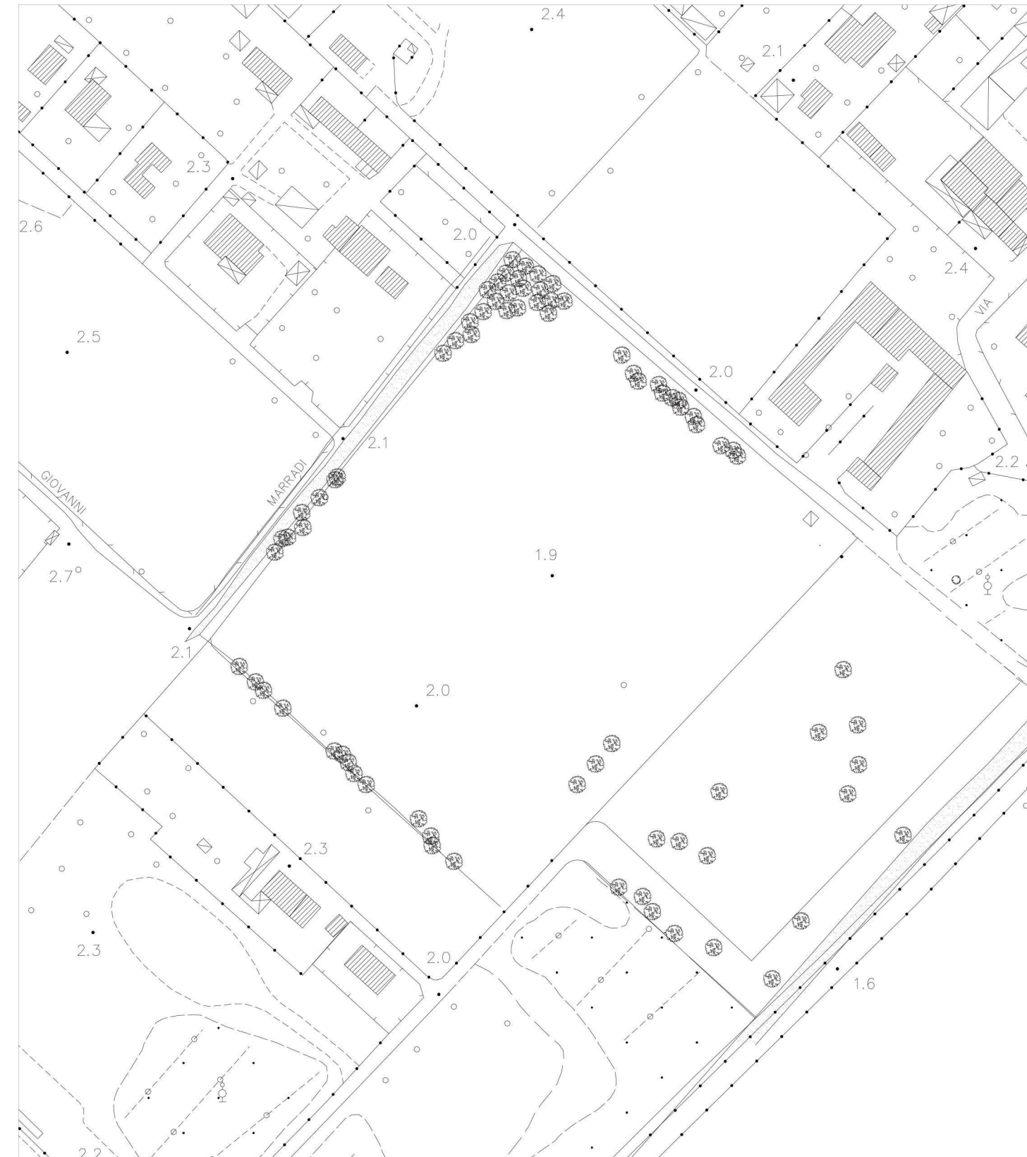
STATO DI FATTO DEL VERDE