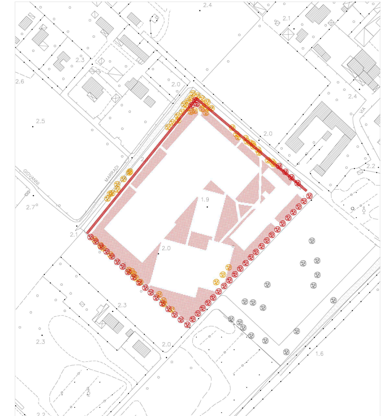
STATO SOVRAPPONTO DEL VERDE