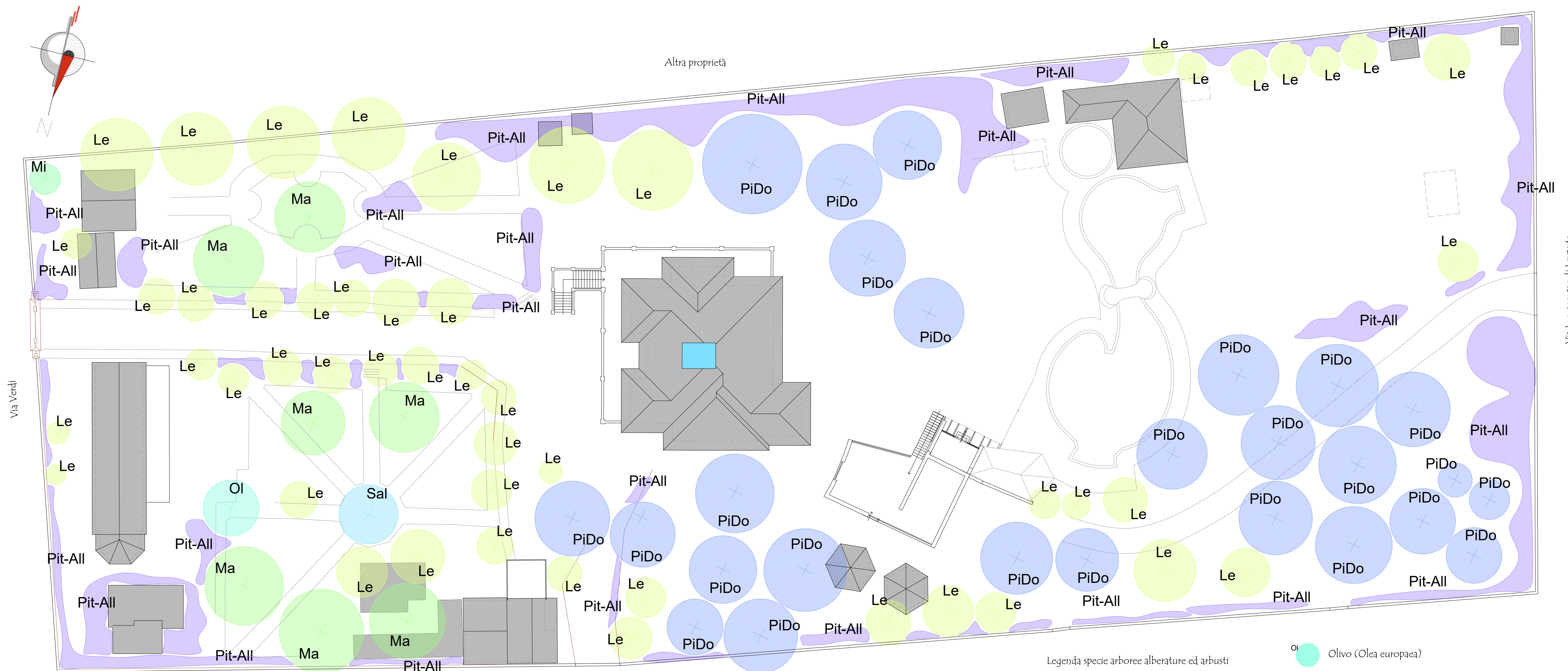
PLANIMETRIA STATO ATTUALE -SCALA 1:250

Progettisti: STUDIO ASSOCIATO BOCELLI ARCHITETTURALMENTE Via Volturna n° 51 56030 Lippara (MS) tel/fax 0587390707 P.IVA 08622380505 info@studiobocelli.com - info@arch.bocelli.com ARCH. ALBERTO BOCELLI