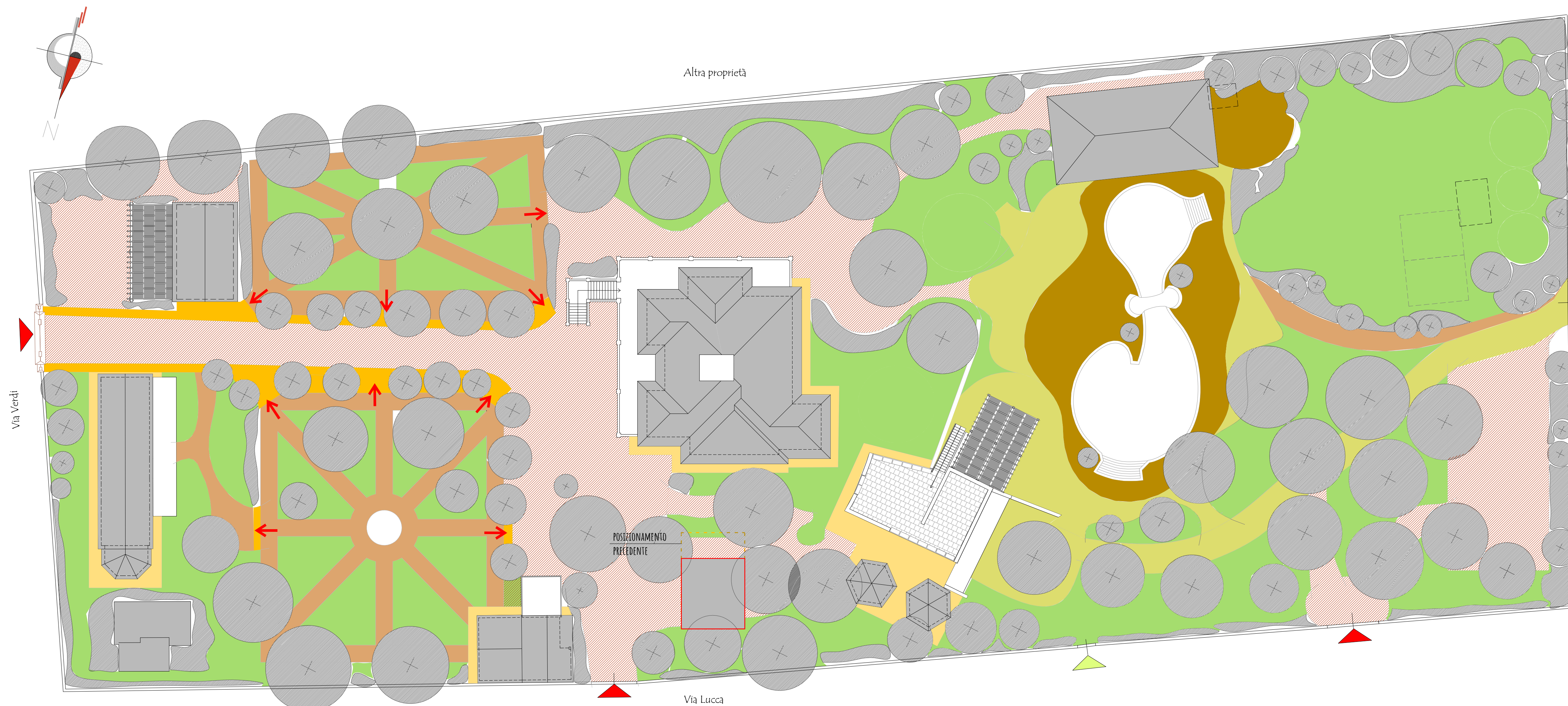
PLANIMETRIA STATO DI PROGETTO - SCALA 1:250