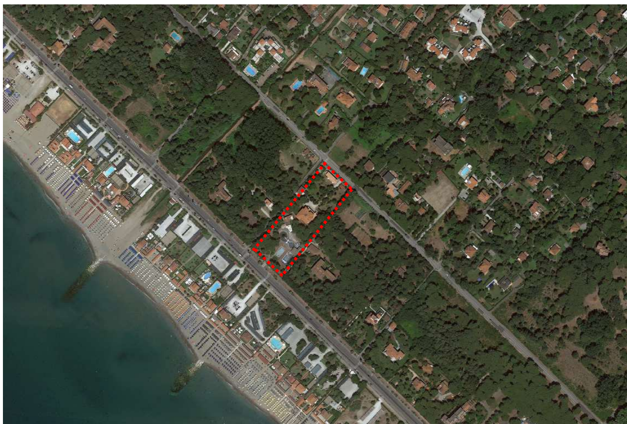
Fig. 3_Vista zenitale ampia

L'accesso all'area avviene attraverso le due infrastrutture principali: via Verdi, accesso carrabile diretto alla villa principale, posta centralmente alla proprietà; via Lungomare di Levante, unico accesso dal mare. All'immobile si può accedere anche da un ingresso secondario posizionato su via Lucca.