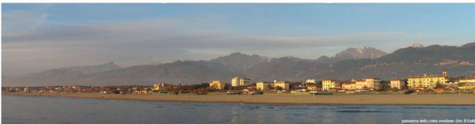
panorama della costa versiliese