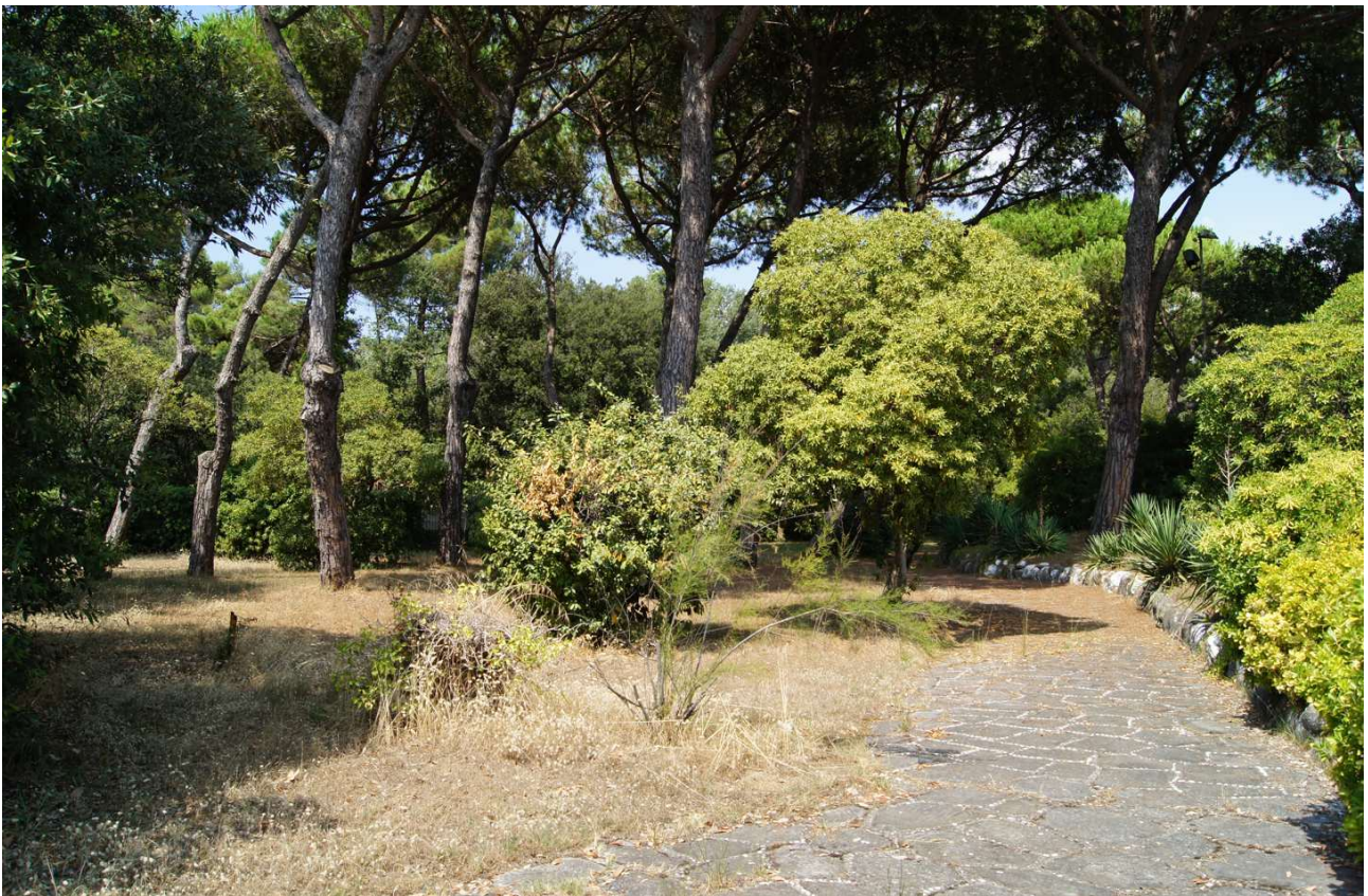
Fig. 9 _ Vista del giardino lato Lungomare