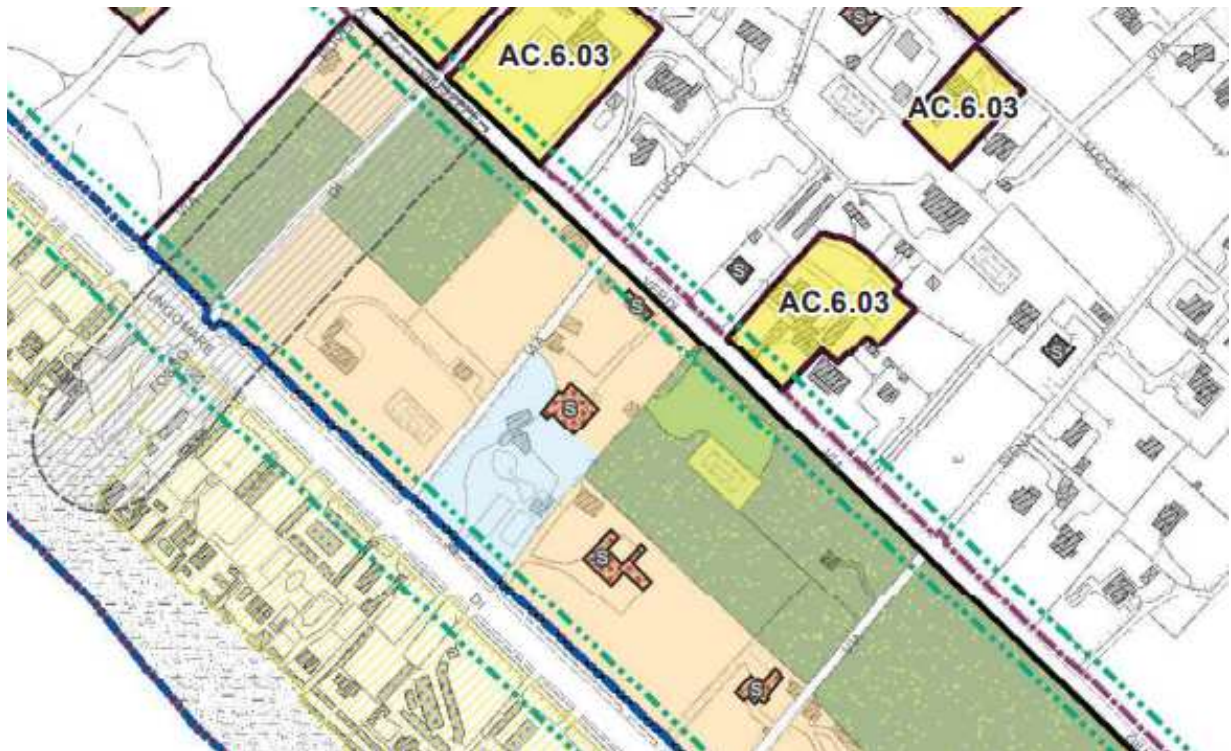
Regolamento urbanistico – Quadro progettuale 1.9 (Disciplina degli insediamenti e perimetro del territorio urbanizzato) – Complesso Ex Oliviero (STATO ATTUALE estratto)