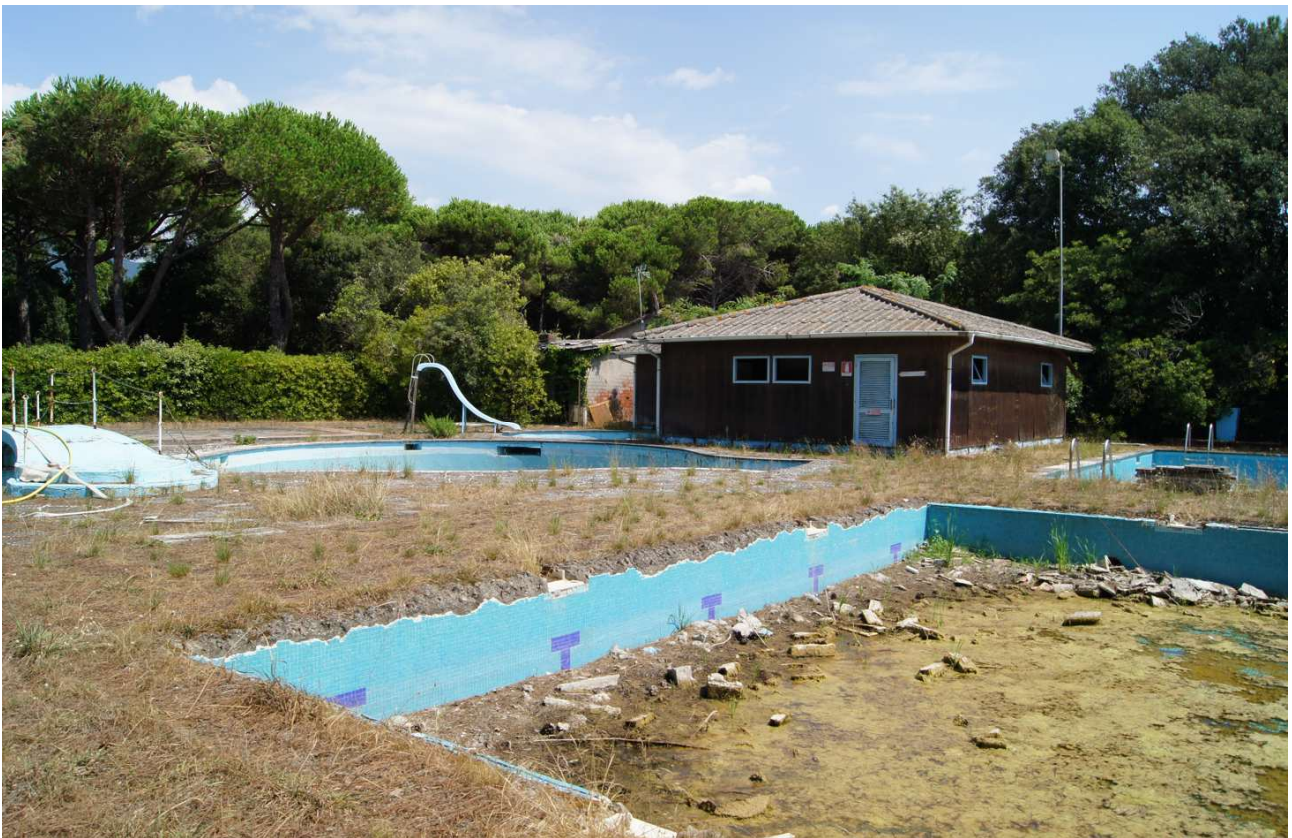
Fig. 5_ Vista delle piscine e di uno degli edifici ad uso accessorio (spogliatoi e docce)