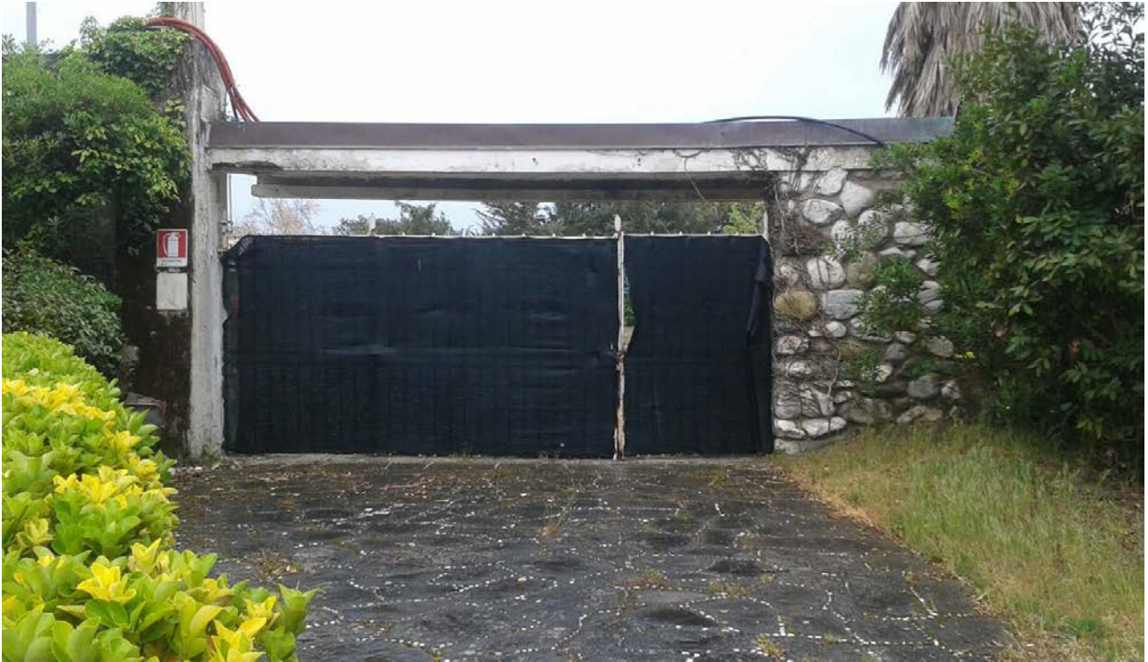
Fig. 4_ Vista dall'interno della pensilina d'ingresso sul Lungomare

(documentazione fotografica risalente all'anno 2019)