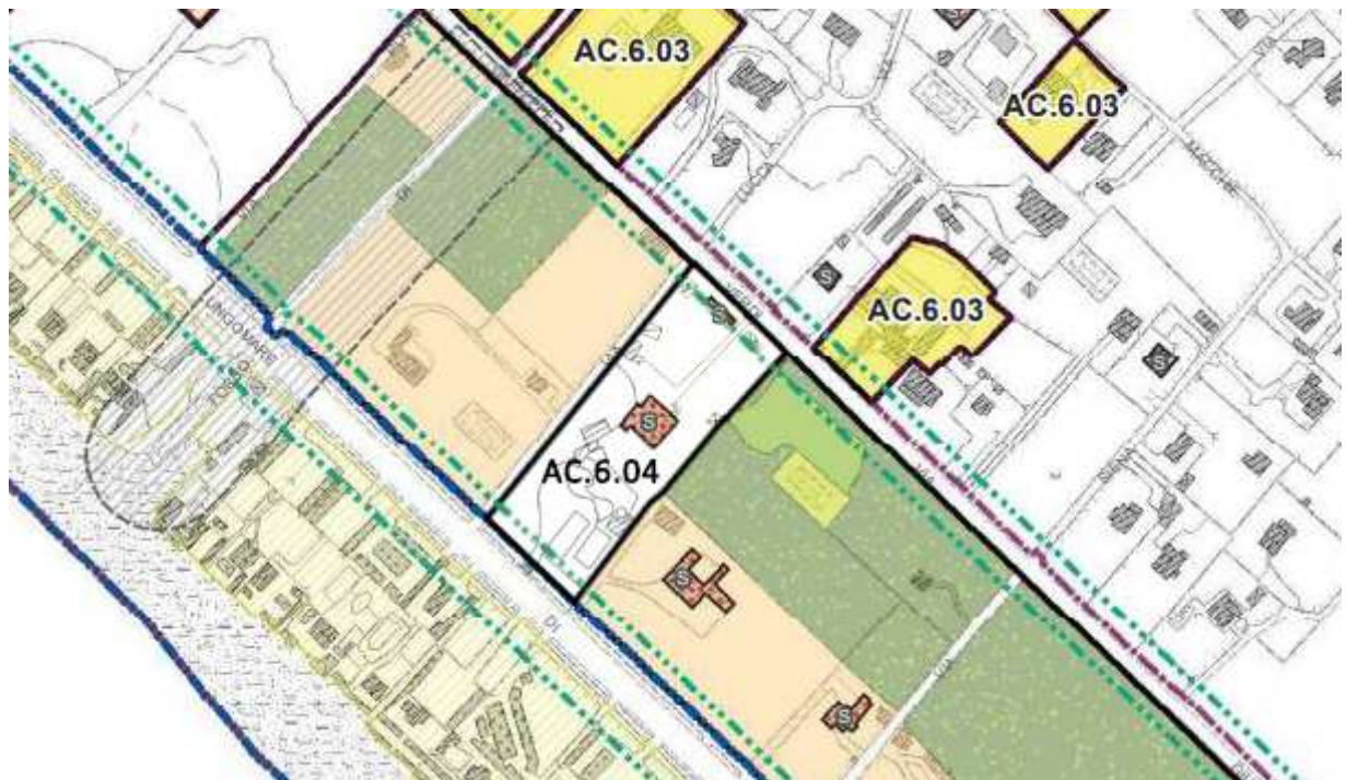
Regolamento urbanistico – Quadro progettuale 1.9 (Disciplina degli insediamenti e perimetro del territorio urbanizzato) – Complesso Ex Oliviero (STATO MODIFICATO estratto)

Via Volterrana n°51 56030 Lajatico (PISA) tel/fax: +390587398070 P.IVA: 01822380505