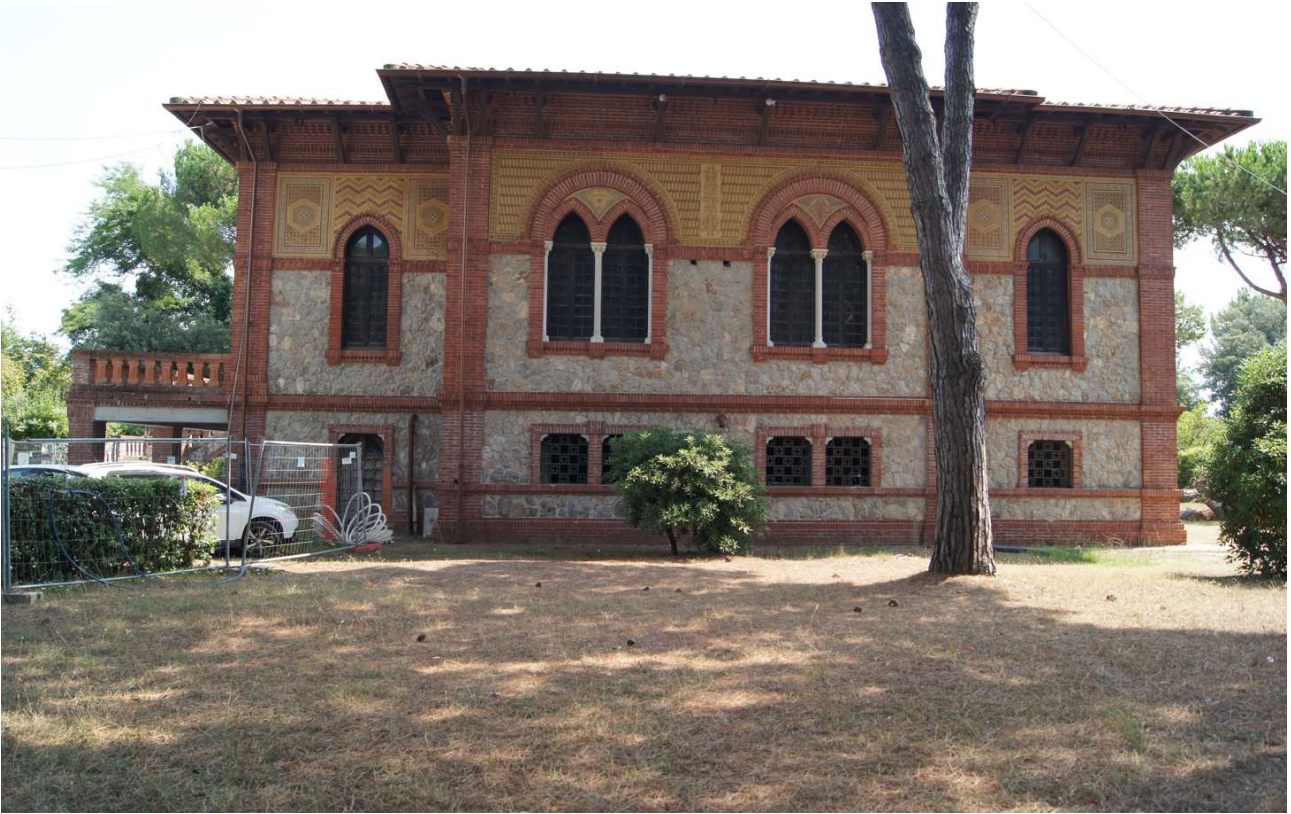
Fig. 6_ Villa principale lato via Lucca