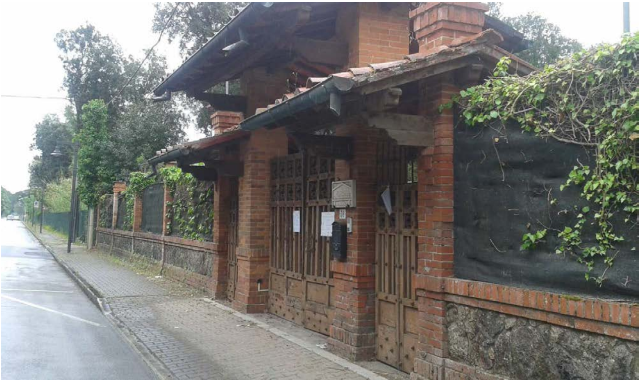
Fig. 8 _ Vista esterna dell'ingresso da via Verdi