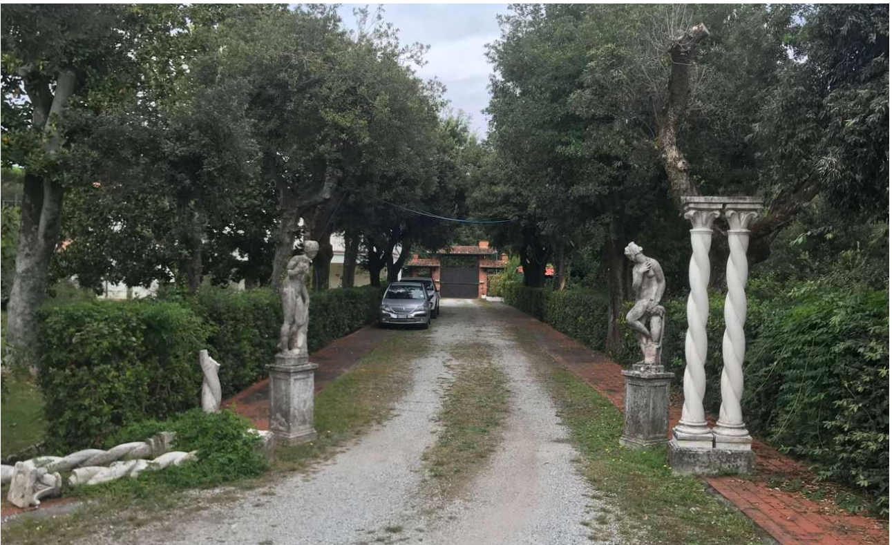
Fig. 7_ Vista interna del viale d'ingresso alla villa da via Verdi