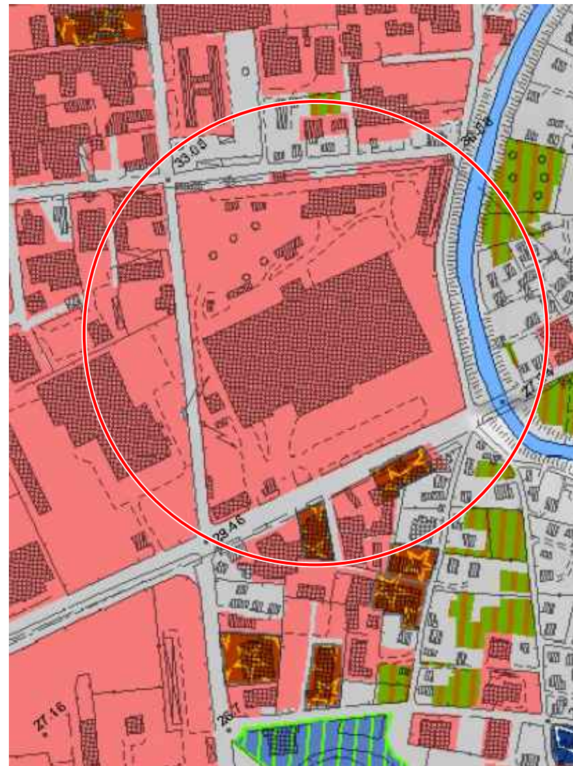
TAVOLA DELLE FUNZIONI ESTRATTO QC DEL PS - Tav. A, 11.b