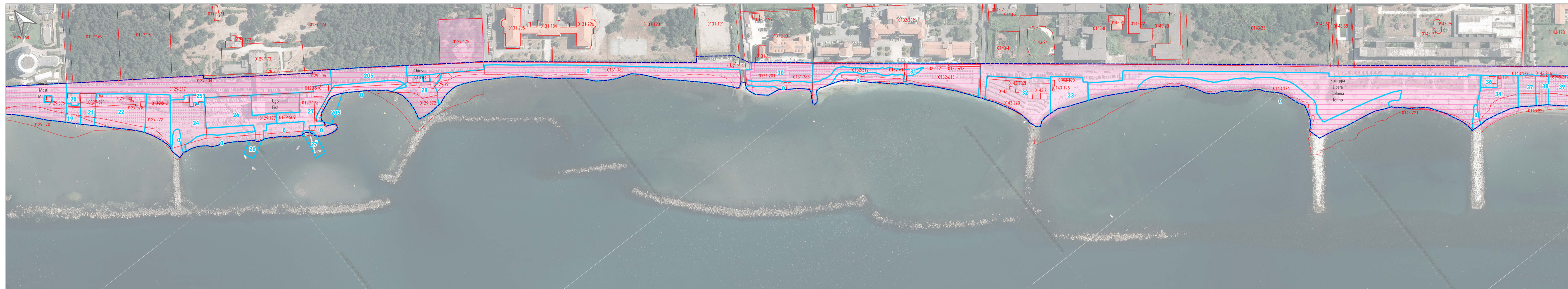
Tratto costiero 2 (ex Colonia Fiat-ex Colonia Torino)