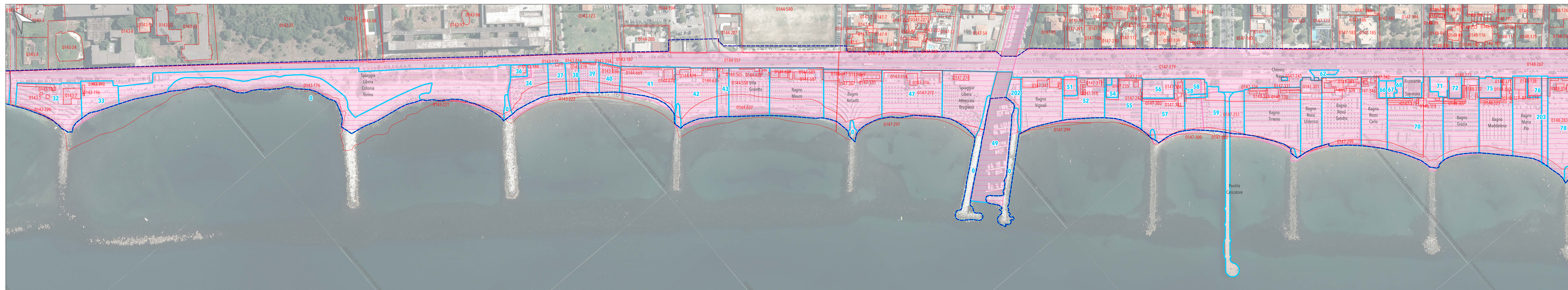
Tratto costiero 3 (Ex Colonia Torino-foce del Brugiano)