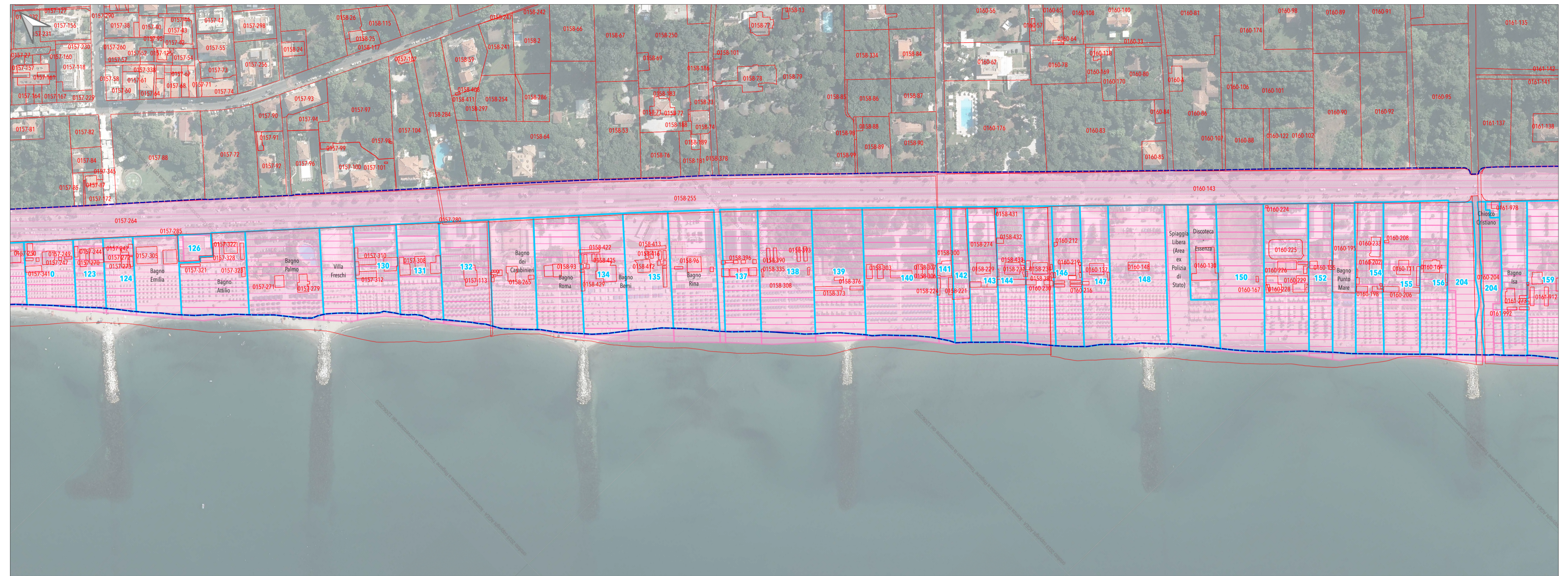
Tratto costiero 6 (Piazza Ronchi-Fosso Poveromo)

TAV. QC.2.3 Demanio, Proprietà e Concessioni Porzione di fascia costiera di Ronchi/Poveromo Settembre 2024 Scala 1:2.000