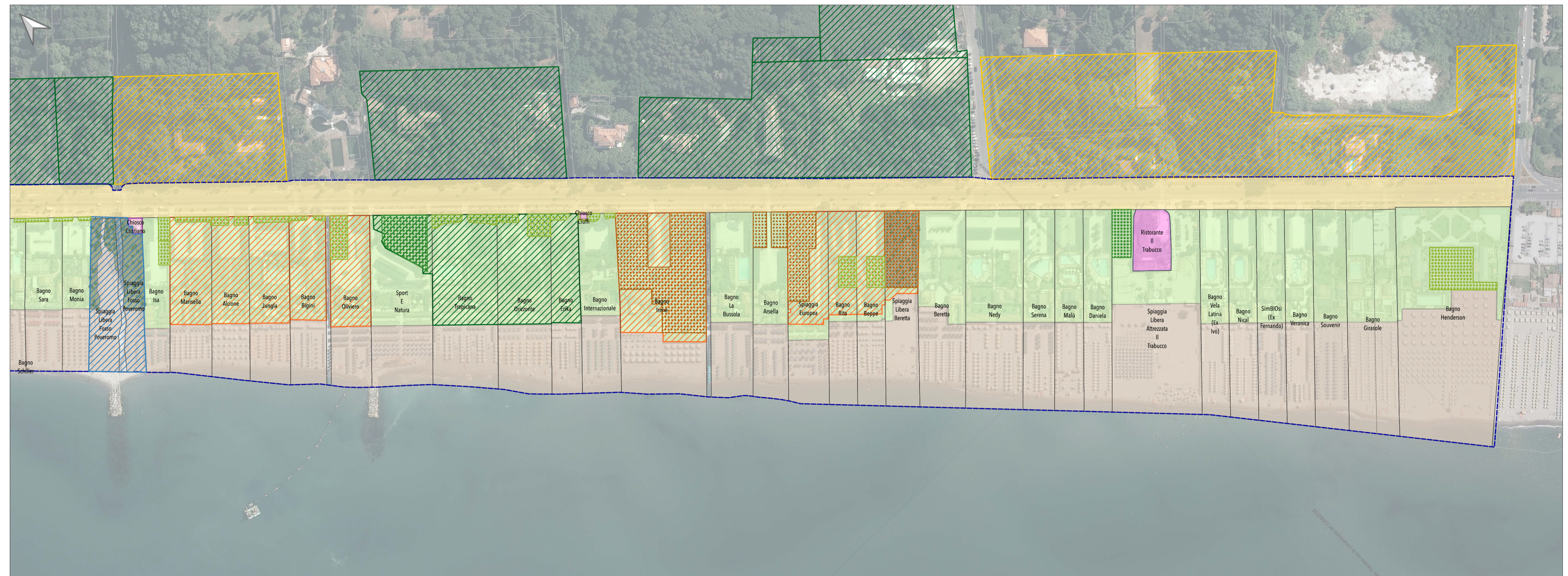
Tratto costiero 7 (Fosso Poveromo- Cinquale)