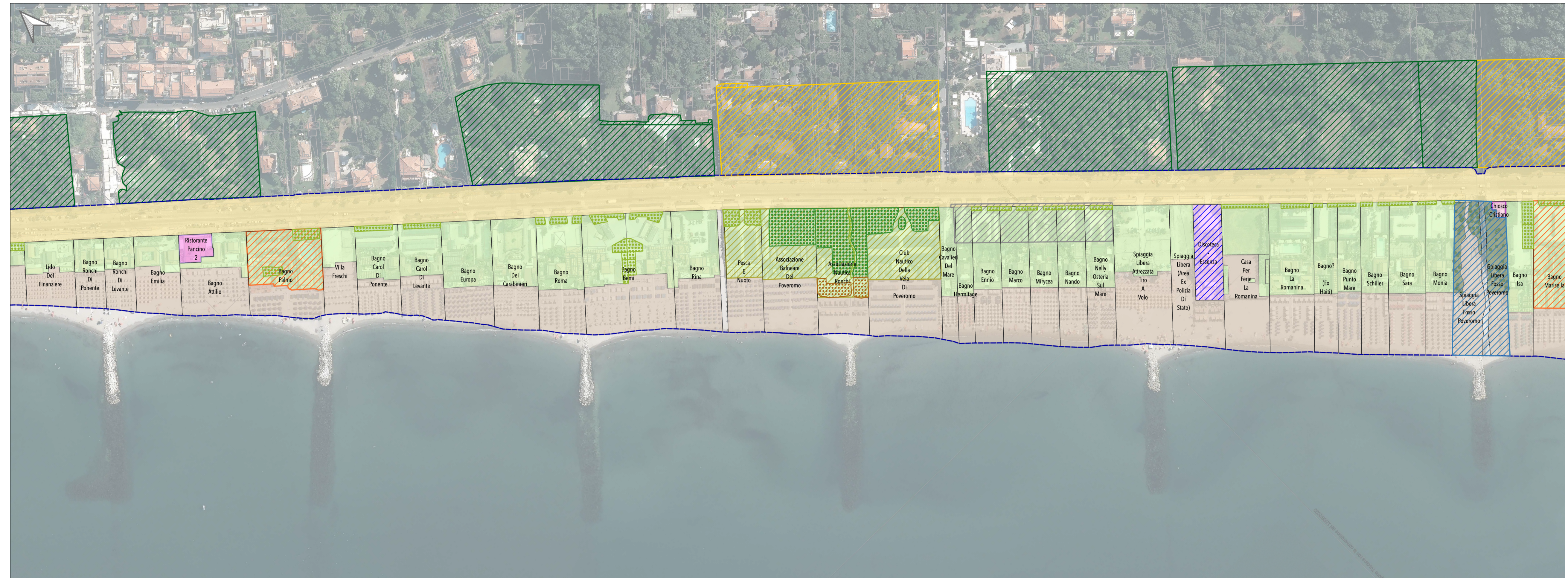
Tratto costiero 6 (Piazza Ronchi-Fosso Poveromo)

Elaborato modificato a seguito accoglimento osservazioni