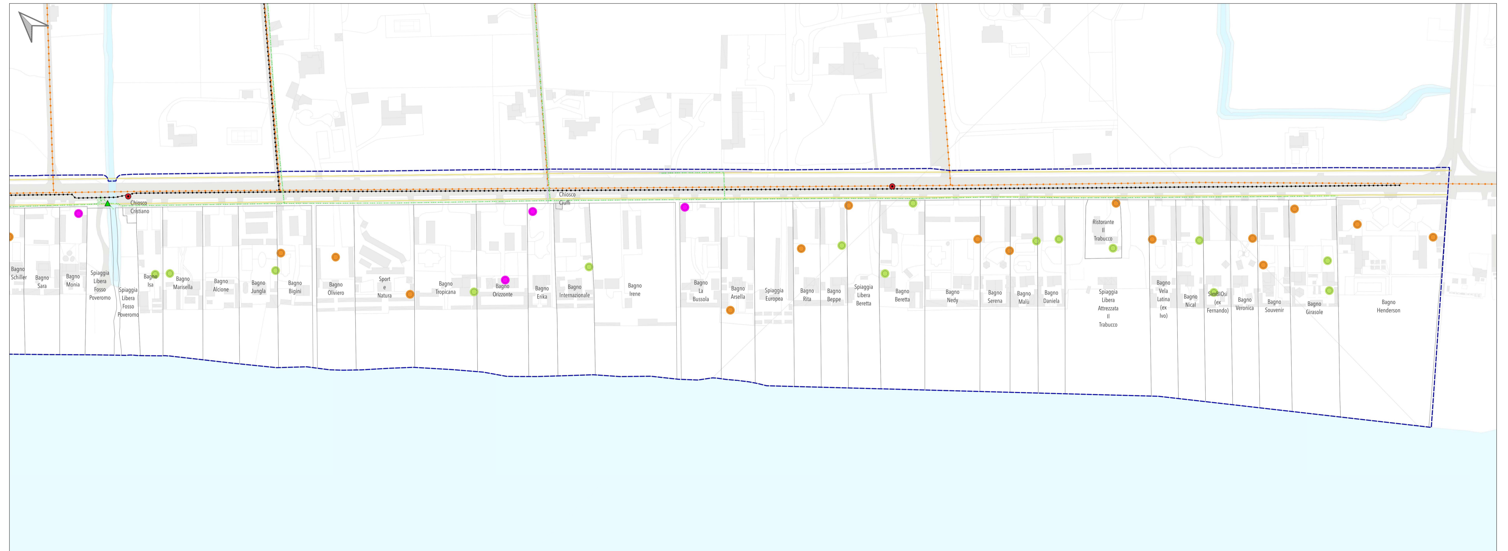
Tratto costiero 7 (Fosso Poveromo- Cinquale)