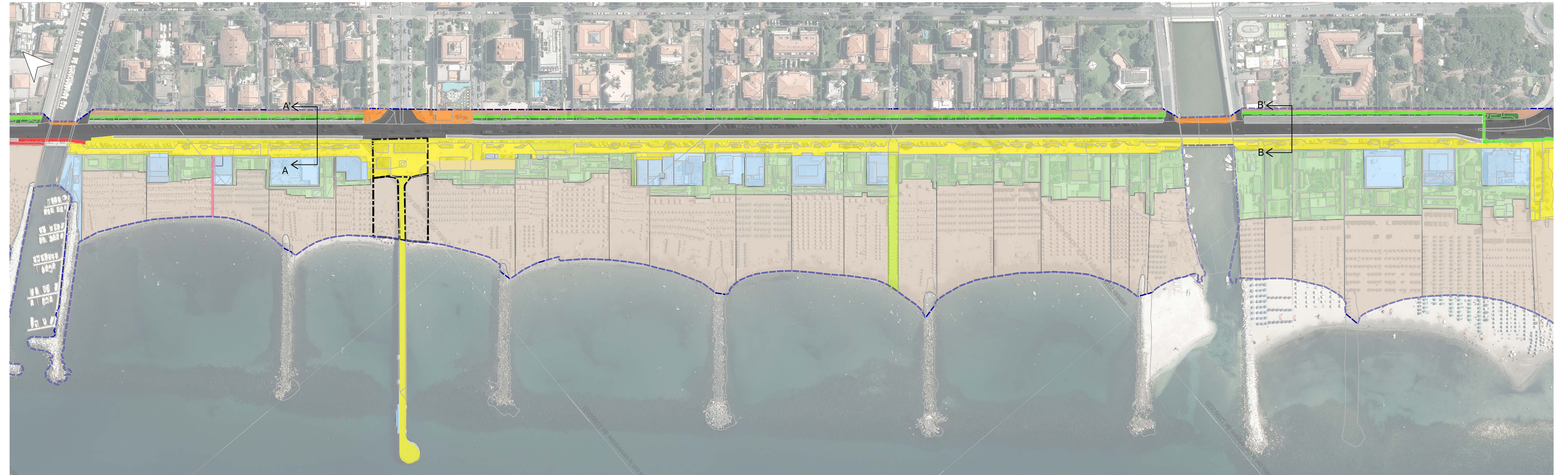
INQUADRAMENTO TRATTO 4