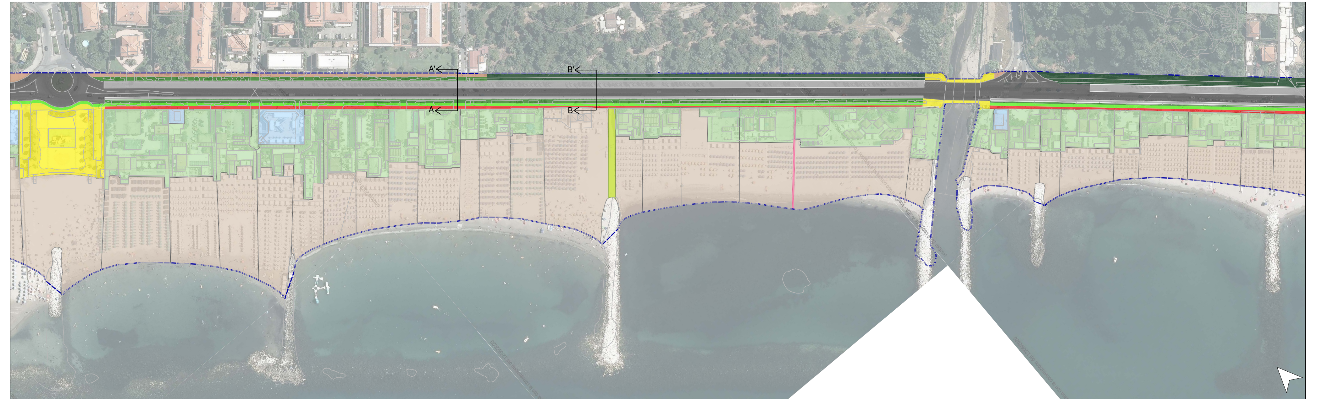
INQUADRAMENTO TRATTO 5